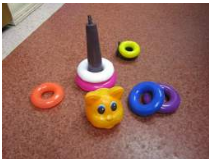
Рисунок 1. Пирамидка с конусообразным стержнем

Очень хорошо, если игрушка имеет автодидактические свойства . Благодаря такой игрушки ребенок учится сам, происходит самообучение. Она уже в своем строении, конструкции подсказывает ребенку, что с ней нужно делать и «указывает» ребенку на его ошибки, сделанные при выполнении того или иного игрового задания. Таким образом, ребенок сам догадывается о правилах игры и способе действий. Например, пирамидка с конусом вместо стержня: если ребенок не будет учитывать размер колец, то он не сможет собрать пирамидку. Таким образом, игрушка сама, своей формой, подсказывает, как в нее играть (рис. 1).