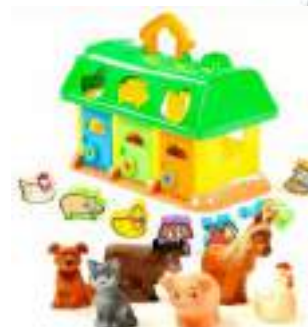
Рис. 53 Полесье. Набор игрушек «Ферма животных»

Ход игры: предложите малышу покатасть зверят в машине, расположите машину и игрушки так, чтобы между ними было небольшое расстояние (примерно в ширину стола). Обратите внимание малыша, что игрушки далеко, их надо позвать. Позовите первую игрушку: «Иди!», подкрепляя слово жестом, и проведите игрушку до машины. Возьмите следующую игрушку, но предложите ребенку самому позвать ее: «А теперь ты зови», покажите жест, но не произносите слово. Если малыш не произносит нужное слово, выполните жест его рукой, а сами произнесите: «Иди!» и доведите игрушку до машинки. Помогайте ребенку по мере необходимости, но не забывайте со временем ослаблять помощь.