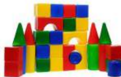
Рисунок 29. Конструктор «Десятое королевство»