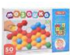
Рисунок 26. Мозаика крупная для самых маленьких

На что обратить внимание: достаточно крупный размер первых мозаик, чтобы ребенку удобно было действовать с деталями, детали должны легко вставляться и выниматься.