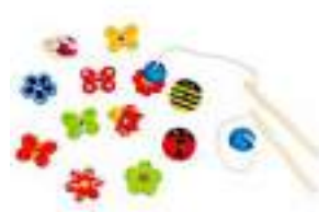
Рисунок 21. Игра «Ловим бабочек»

Ребенок раннего возраста много двигается, поэтому неплохо иметь в арсенале подвижные игры на налаживание взаимодействия, как со взрослым, так и в небольшой группе детей, например, на детской площадке.