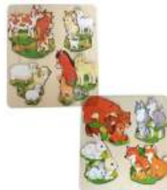
Рисунок 45. Деревянный сортер «Больше-меньше. Мама и детеныши»

Преимущества игрушки: игрушка выполнена из дерева, реалистические рисунки.