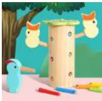
Рисунок 24. Магнитная рыбалка «Покорми птенца»