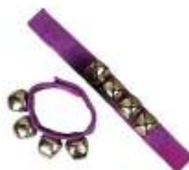
Рис. 55. Звонящие браслеты