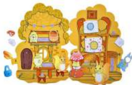
Рисунок 39. Развивающая игра на липучках Smile Deco "Белкин дом",

Преимущества игрушки: игрушки изготовлена из приятного на ощупь материала - фетра; детали легко крепятся друг к другу с помощью липучек.