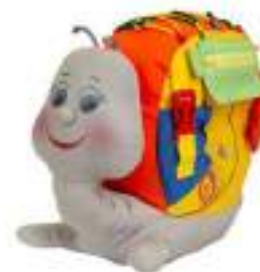
Рисунок 37. Развивающая мягкая игрушка с застежками "Улитка"

Преимущества игрушки: материал игрушки (винил и кожа) приятен на