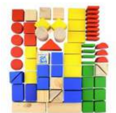
Рисунок 28. Конструктор деревянный