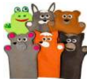
Рисунок 20. Театр на руку из фетра по сказке "Теремок"

На что следует обратить внимание: на форму, размер и качество игрушки. Размер игрушки должен быть достаточным, для рассмотрения разных частей тела (например, глаза, уши, лапы), цвета игрушек должны быть похожи на естественные, встречающиеся в природе (т.е. не стоит покупать голубого слона или розового зайца).