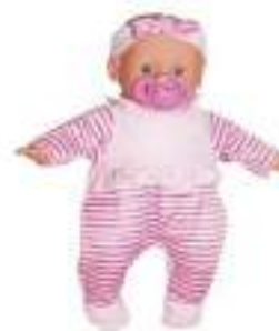
Рисунок 35. Little you Пупс Малютка с соской

Преимущества игрушки: игрушка может быть использована в процессе формирования культурно-гигиенических навыков у вашего ребенка. К ней предлагается набор предметов (горшок, зубная щетка, расческа и т.д.), существует множество игр, в которых вы можете закреплять навыки самообслуживания. Для этого вам могут пригодиться дополнительная одежда и мебель для куклы.