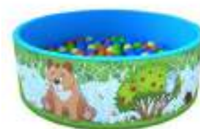
Рисунок 62. Сухие бассейны