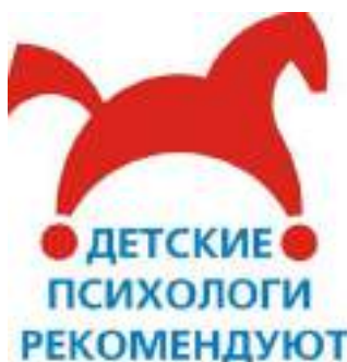
Рисунок 3. Знак «Детский психолог рекомендует»

С 2004 года при МГППУ существует Московский городской центр игры и игрушки. В нем разработана методика психолого-педагогической экспертизы разных видов игрушек и игровых материалов. В процессе данной экспертизы оценивается развивающий потенциал игрушек, их пригодность для разных видов детской игры, возрастная адресность игрушек, а также этические и эстетические качества. Игрушки, получившие высокие оценки, удостоиваются специального знака качества «Детские психологи рекомендуют» и подтверждающего сертификата. Если на упаковке игрушки есть такой знак – это означает, что она рекомендована профессионалами (рис. 3).