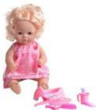
Рисунок 34. Пупс Оленька