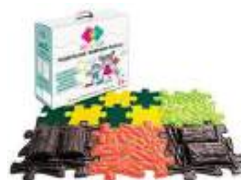
Рисунок 59. Коврик-пазл, ортопедический

На что обратить внимание: у каждого коврика разная фактура, что обеспечивает массаж ног; коврики можно использовать как одновременно, так и по одному; яркий цвет привлекателен для ребенка; хорошо моются; прилагается инструкция по массажу стоп.