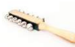
Рис. 56. Маракас