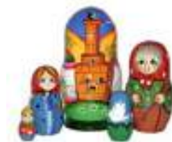
Рисунок 18. Матрешка сказка «Гуси лебеди»

На что следует обратить внимание: чтобы игрушка достаточно плотно закрывалась, но при этом легко открывались, чтобы ребенок мог ее открыть самостоятельно.