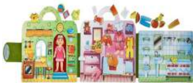
Рисунок 38. Сумка-игралка Smile Deco "Кукольный домик" в сумочке