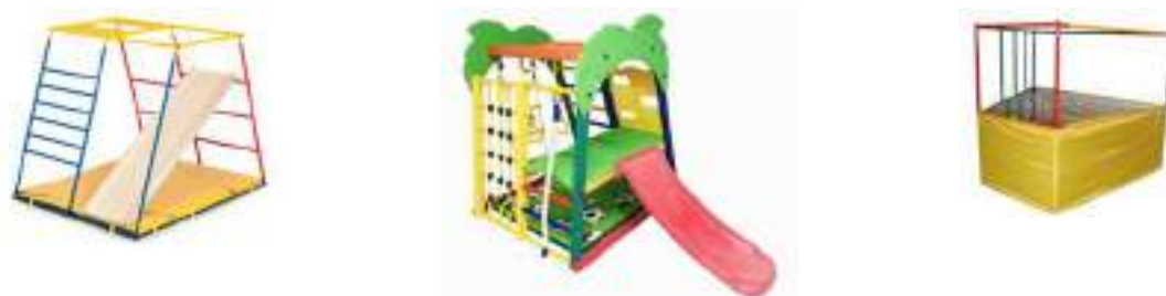
Рисунок 60. Спортивно-игровые комплексы

На что обратить внимание: спортивно-игровой комплекс – это набор элементов, основой которого является шведская стенка. Обязательным атрибутом безопасности должен быть мат. Для большей безопасности можно приобрести к комплексу защитную стенку. Важно, чтобы комплекс был хорошо зафиксирован и если он сделан из дерева, то хорошо отшлифован (без заусенцев). Перекладины должны быть не толстыми, чтобы маленьким ручкам ребенка было удобно их обхватывать. В перспективе можно дополнить комплекс наклонной скамьей, кольцами, канатом с опорами и др.