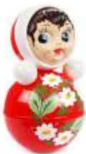
Рисунок 57. Игрушка-неваляшка

Для мотивации ребенка хорошо использовать яркие, звучащие, привлекающие внимания игрушки, например, неваляшки (рис. 57).