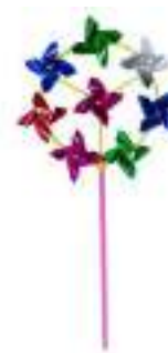
Рис. 49. Игрушка ветерок «Круг»

Цель: развивать способность к копированию мимики взрослого, развивать возможность к повторению звукоподражаний вслед за взрослым.