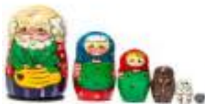
Рисунок 17. Деревянная матрешка «Репка»