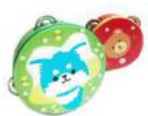
Рис. 54. Бубен