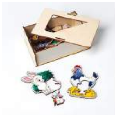
Рисунок 44. Пазлы "Мамы и детёныши"