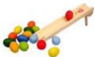
Рисунок 11. Игрушка «Горка пасхальная»