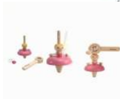
Рисунок 12. Волчок – Балерина

На что обратить внимание: желобок должен быть адекватного размера (соизмеримого со столом, на котором будут проводиться занятия) для того, чтобы ребёнок мог самостоятельно дотянуться до желобка и опустить на него шар.