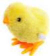
Рисунок 13. Цыпленок заводной

Для налаживания коммуникации и формирования желания взаимодействовать со взрослым можно использовать маленькие заводные игрушки , имитирующие действия (клюющие, прыгающие, танцующие, музицирующие) с различными эффектами (музыкальным, шумовым, цветовым, световым). Например, цыпленок, петушок. (рис. 17,18).