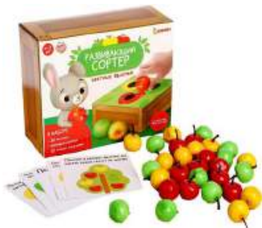
Рисунок 40. Детский развивающий сортер "Цветные яблочки"