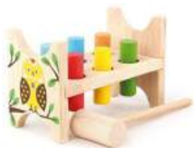
Рисунок 30. Стучалка «Лесная сова»