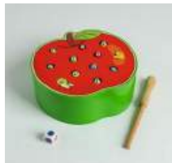
Рисунок 25. Игра магнитная рыбалка «Спелое яблочко»