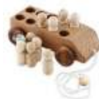
Рисунок 16. Деревянная машинка с 10 пассажирами, Леснушки

На что следует обратить внимание: выбирать игрушки из натурального материала, небольшого размера, среднего веса (для удобства игры на разной поверхности и навесу).