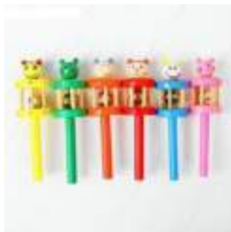
Рисунок 5. Погремушка «Весёлый зоопарк», с бубенчиком внутри