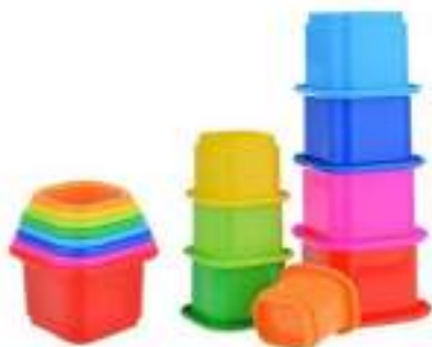
Рисунок 42. Пирамидка детская стаканчики "Занимательная 2", Стеллар Stellar