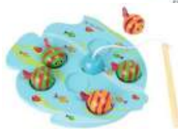
Рисунок 31. Игровой набор «Рыбалка»