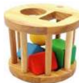
Рисунок 41. S-mala Первый сортер

Преимущества игрушки: игрушки изготовлены из приятного на ощупь материала; в игрушке представлены основные цвета, детали крупные с закругленными гранями.