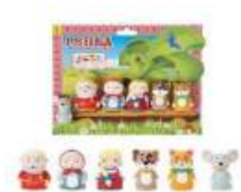
Рисунок 19. Пальчиковый театр «Репка»

Много радости приносят театральные игрушки, пальчиковые, ручные куклы (рис.19-20). С помощью них можно развивать коммуникативные способности ребёнка в процессе проигрывания сказки, развивать эмоциональное взаимодействие, демонстрируя разные интонации и характер сказочных героев.