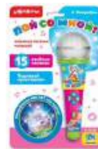
Рис. 51. Микрофон фирмы «Азбукварик» «Пой со мной!».