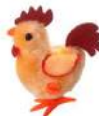
Рисунок 14. Пасхальный петух

На что следует обратить внимание: на размер, цвет и форму игрушки. Игрушка движется, и игрушка большого размера может напугать ребенка.