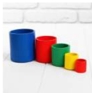
Рисунок 43. Деревянная детская игрушка-пирамидка "Стаканчики"

Преимущества игрушки: яркие цвета игрушки.