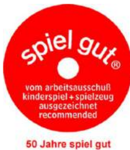
Рисунок 2. Знак «Spiel gut»

но достаточно дорогие, такую игрушку покупают «на века» и передают в семье из поколения в поколение (рис.2).