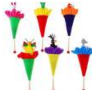
Рисунок 8. Петрушка-животные

На что обратить внимание: заказывая игрушку в интернете, обратите внимание на размер игрушки и качество (конус деревянный, а не картонный, палочка и шарик достаточного размера, удобные для руки ребенка).