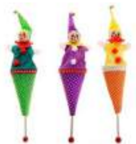
Рисунок 7. Сувенир на палочке "Человечек"

Для налаживания контакта и привлечения ребёнка к игре служат народные игрушки, игрушки-забавы, они смогут отвлечь от неприятной ситуации и нежелательного поведения, снять стресс и успокоить малыша, сформировать желание участвовать в совместной игре. Например, петрушка, который прячется в конус . Малыши любят играть в «прятки» с таким Петрушкой (Рис.7.8).