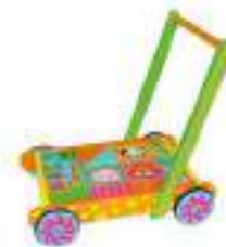
Рисунок 58. Игрушка-каталка

На что обратить внимание : игрушка должна быть с добрым лицом, мелодичным звуком.