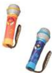
Рис. 50. Записывающий игрушечный микрофон «Okideoki»