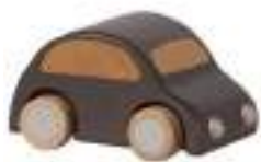
Рисунок 15. Деревянная машинка

Прокатывающиеся игрушки стимулируют речевую активность в предметно игровом взаимодействии (рис. 19, 20).