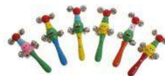
Рисунок 6. Погремушки с бубенцами

Ход игры: возьмите погремушку в руку, покажите ее малышу и произнесите: «посмотри, какая игрушка у меня есть!», побуждайте ребёнка к речевой активности: «Кто это? - правильно, собачка, ав-ав!». «Сейчас она спрячется от тебя, а ну-ка отыщи ее!». Если ребёнок бездействует, извлеките из игрушки звук, при этом обращаясь к ребёнку: «Слышишь? Она где-то звенит! Найди её!» Попросите ребенка взять игрушку, предложите спрятать погремушку самостоятельно.