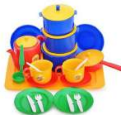
Рисунок 33. Набор детской посуды Полесье Рисунок 34. Игровой набор детской посуды для кукол КНОПА "Хозяюшка"

Преимущества игрушки: разнообразный набор предметов; достаточный размер, представленные предметы окрашены базовыми цветами.