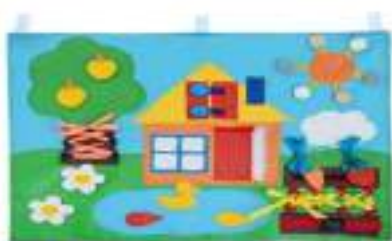
Рисунок 36. Коврик развивающий тактильный IQ-ZABIAKA