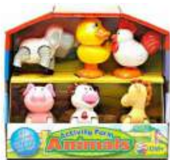
Рис. 52. Activity Farm «Animals».