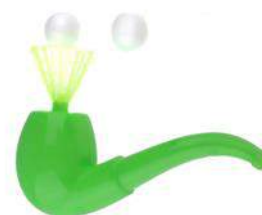
Рис. 47. «Аэробол»

Цель: развивать плавный речевой выдох, плавный продолжительный выдох.