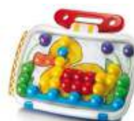
Рисунок 27. Мозаика для малышей