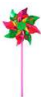
Рис.48. Игрушка «Ветерок» розовый