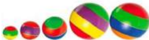
Рисунок 4. Мячи резиновые (комплект из 5 мячей различного диаметра)

Для того, чтобы наладить эмоциональный контакт, начать игру с малышом хорошо подойдут следующие игрушки: набор игровых мячей (рис. 4).